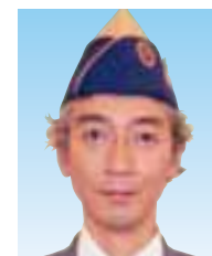
ZC (5R2Z) L 於本 淳 (八戸中央)