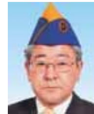
ZC (1R2Z) L 天内 修 (青森中央)